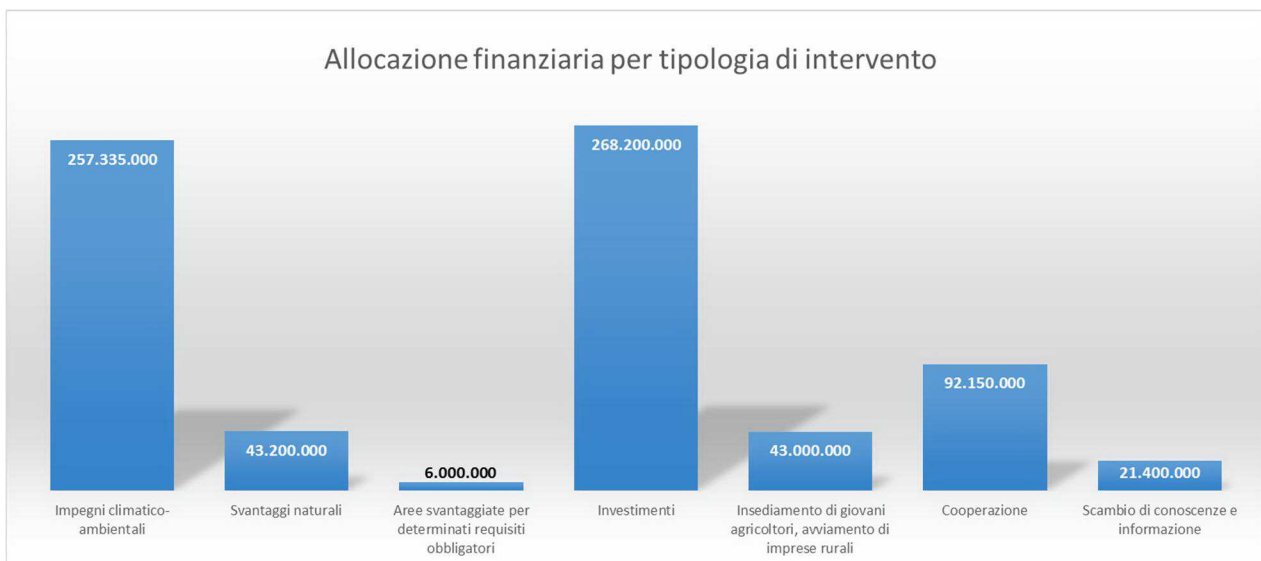
Figura 1 - Riparto fondi per tipologia di intervento

Si riporta di seguito la ripartizione delle risorse finanziarie in termini di tipologie di intervento