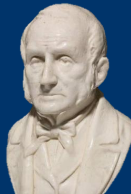
Alessandro Manzoni (1785 – 1873)